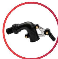
Válvula de llenado de 1/2"