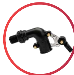
Válvula de llenado de 1/2"