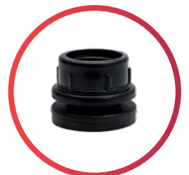
Brida de 1 1/2"