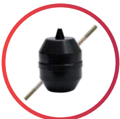
Flotador #5 con varilla