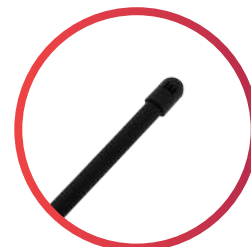
Jarro libera aire de 1/2\"x141 cm de alto